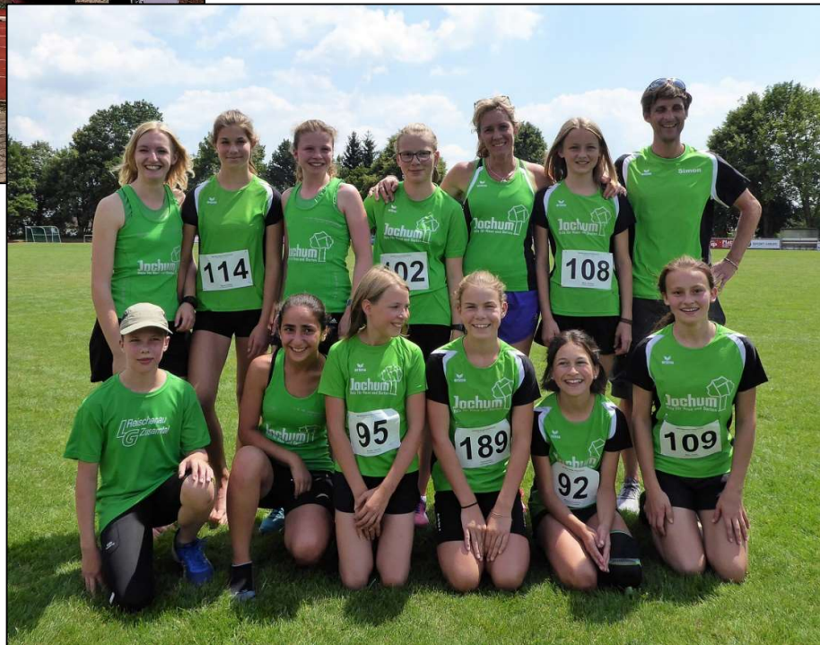
Die U16 und U14 bei den Kreismeisterschaften in Horgau.